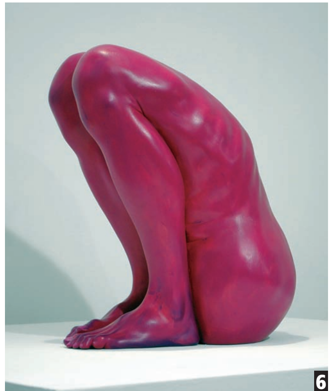
1 Dragoș Burlacu, Babel... Falasarna , 2010, oil on canvas, 50 x 150 cm, Courtesy Năsui Gallery; 2 Aurel Tar, Uzbek dollar , Eurocentric Circus Maximus, 2009, acrylic on canvas, 91 x 91 cm 3 Colorând Griul @ Artplay Moscova, Bogdan Rață, sculptură, Aurel Tar, pictură 4 Francisc Chiuariu, Outdoor-winter3 , 2011, ulei-cerneală tipografică pe backlit, 80x120 cm, colecția artistului 5 Cătălin Petrișor, To heal a wounded surfer , 2011, oil and graphite on canvas, 60 x 80 cm, detail of the installation 6 Bogdan Rață, Lonely , polyester, synthetic resin, fibre, paint, 2011, 42x33x25 cm, Courtesy Năsui Gallery, photocredit LC Foundation